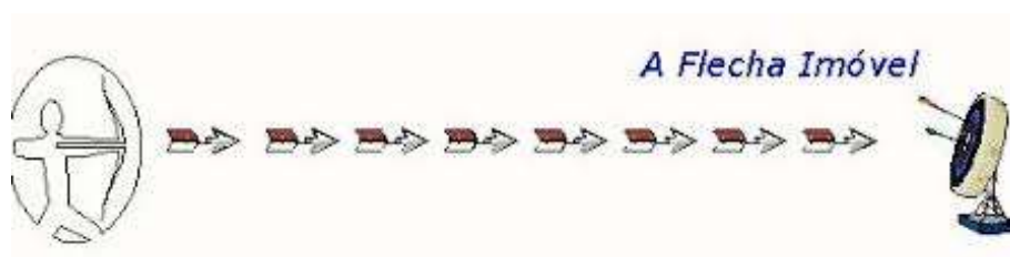
Figura 3: O paradoxo da Flecha disparada