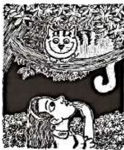
Figura 4: Trecho do livro Alice no país das maravilhas de Lewis Carroll

[...] – Que tipo de gente mora aqui por perto? – Naquela direção – disse o Gato, acenando com a pata direita – mora um Chapeleiro. E naquela – mostrou com a outra pata – mora uma Lebre de Março. Você pode visitar qualquer um dos dois, à sua escolha. Tanto faz. Todos dois são malucos. – Mas eu não quero me meter com malucos – observou Alice. – Não dá para evitar – disse o Gato. – Aqui somos todos malucos. Eu sou maluco, você é maluca... – Como é que você sabe que eu sou maluca? – Só pode ser – disse o Gato. – Senão, não tinha vindo para cá. Alice achou que isso não provava nada. Mas prosseguiu: – E como é que você sabe que é maluco? – Bom, para começar – explicou o Gato – um cachorro não é maluco. Concorda? – Acho que sim. – Pois então... – continuou o Gato. – A gente vê que um cachorro rosna quando está zangado e abana o rabo quando está satisfeito. Mas eu, não. Eu rosno quando estou satisfeito, e abano o rabo quando estou com raiva. Portanto, sou maluco. – Eu diria que você ronrona, não rosna – disse Alice. – Pode dizer o que quiser – disse o Gato. – Você vai jogar croquet hoje com a rainha? – Gostaria muito, mas ainda não fui convidada. – Você me vê lá – disse o Gato e desapareceu. Alice não se surpreendeu muito, estava se acostumando com as coisas esquisitas que aconteciam [...].” (CARROLL, 2018, p. 66-68).